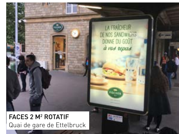
FACES 2 M² ROTATIF Quai de gare de Ettelbruck