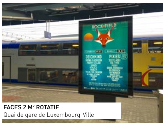
FACES 2 M² ROTATIF Quai de gare de Luxembourg-Ville