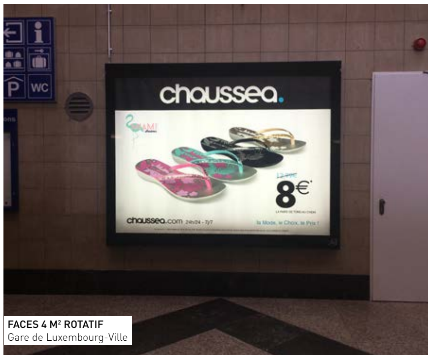
FACES 4 M² ROTATIF Gare de Luxembourg-Ville