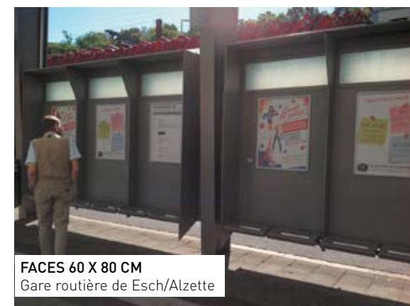
FACES 60 X 80 CM Gare routière de Esch/Alzette