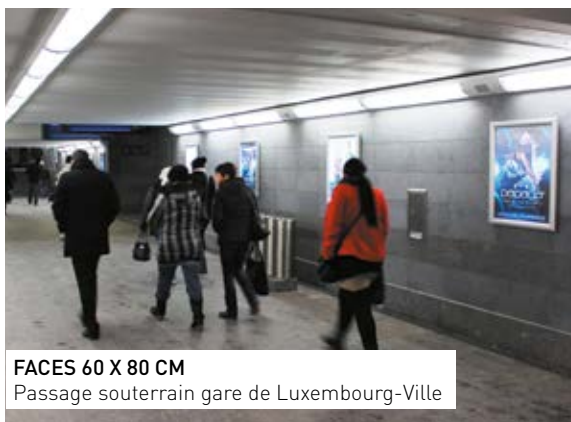
FACES 60 X 80 CM Passage souterrain gare de Luxembourg-Ville